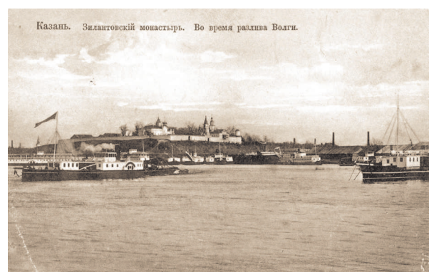
Казань. Зилантовский монастырь. Во время разлива Волги.