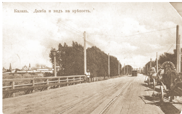
Казань. Дамба и вид на крепость.